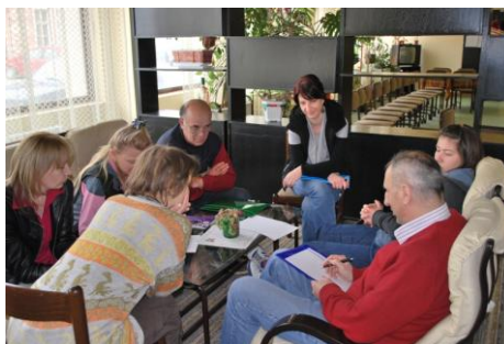
Polaznici seminara vežbaju pisanje peticije