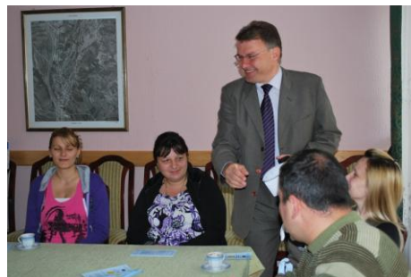
Otvorena vrata u Ražnju