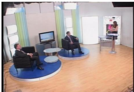
Gostovanje predsednika opština na NTV