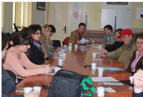
Javni sastanak u Aleksincu