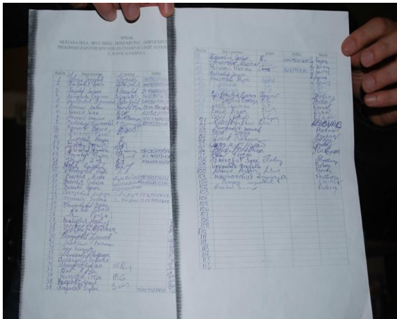
Inicijativa meštana aleksinačkih sela