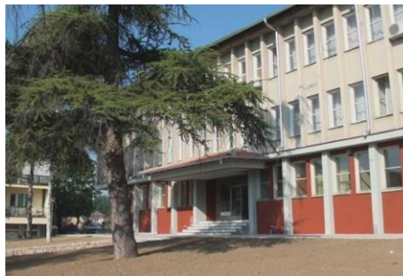
Zgrada Skupštine opštine u Ražnju