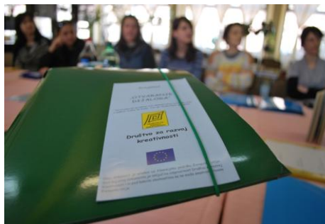
Promotivni materijal za projekat „Otvaranje dijaloga”