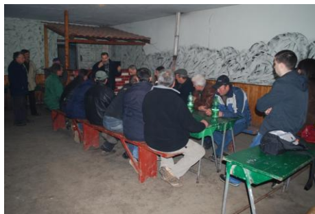
Tribina u selu Gredetin