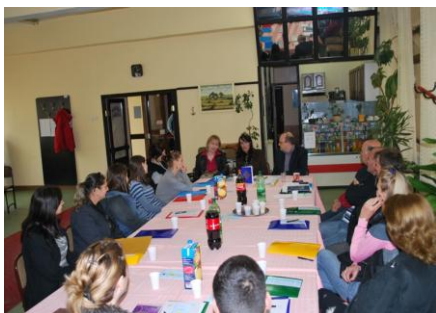
Seminar „Otvaranje dijaloga”