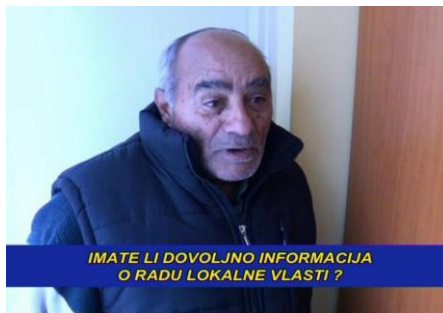
Iz TV spota