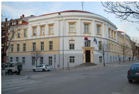
Zgrada Skupštine opštine u Aleksincu