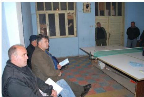
Tribina u selu Vukanja